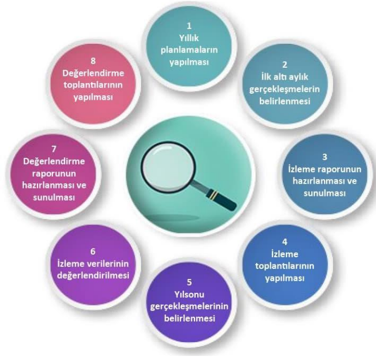
Şekil-4 İzleme ve Değerlendirme Süreci

İzleme ve değerlendirme sürecinin işleyişi ana hatları ile yukarıdaki şekilde özetlenmiştir.